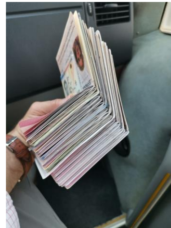
LA UCA TRASPASANDO FRONTERAS