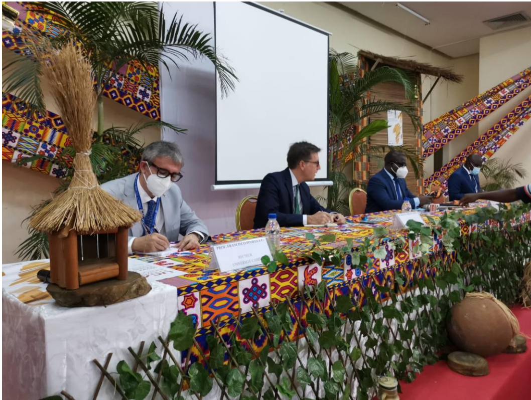
ABIDJAN. COSTA DE MARFIL